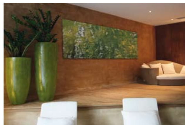
... und im Golf & Spa Resort Andreus, St. Martin.