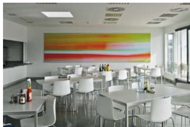
Kunstvolle Räume bei Paul Green, Mattsee, ...