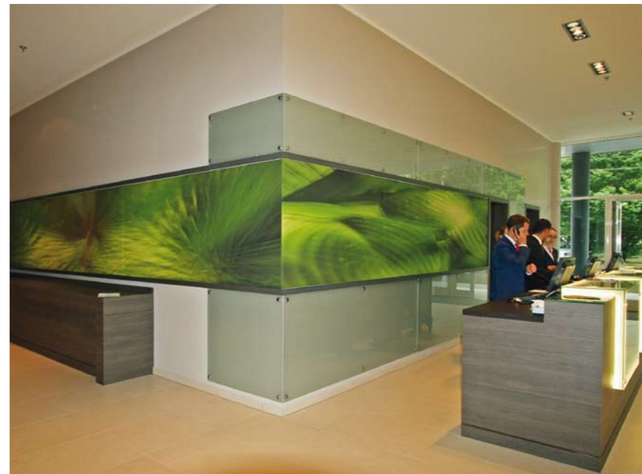
Kreativer Blickfang im Park Inn, Linz.

Umfassendes Servicepaket. Die vollständige Leistungskette – angefangen vom ersten Workshop über Raumaufnahme, Wettbewerb, Jurierung, Werkauswahl, Produktion und Hängeplan bis hin zur Montage – wird nach Kundenwunsch durch Kunstkontakt aus einer Hand erledigt.