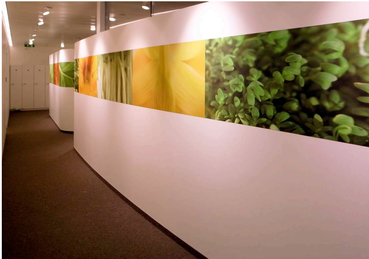
Farbreflexion durch gezielte Lichtkegel auf das gesamte Bildband