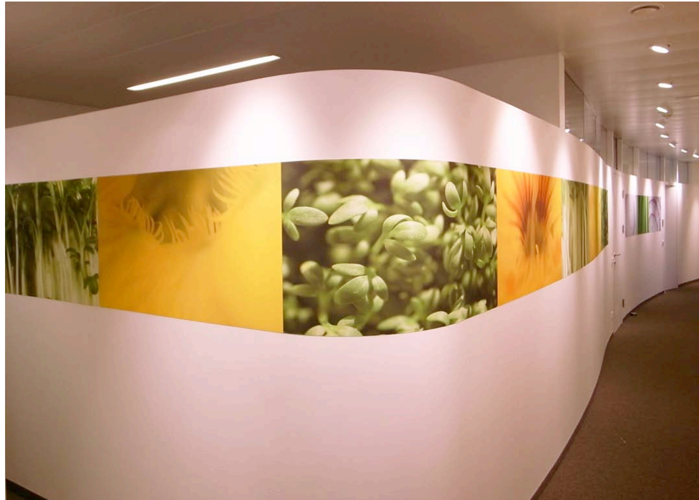
Frisches Grün und warmes Gelb bzw. Rot im rhythmischen Bildwechsel