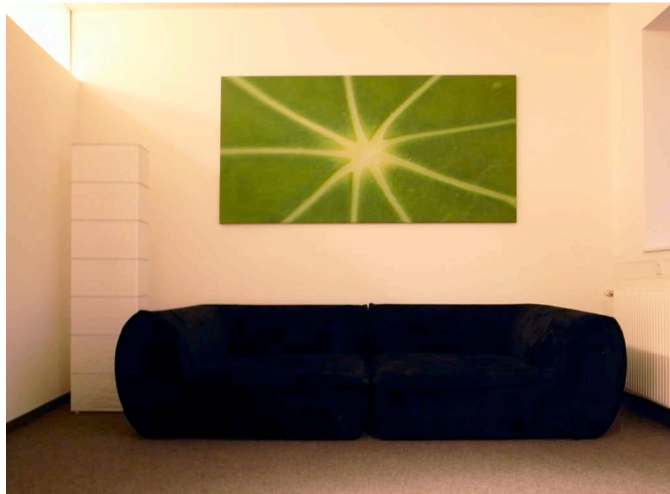
Kantine und Personalraum

Blattadern als Symbol für Treffpunkt und Begegnung kombiniert im frischen Grün