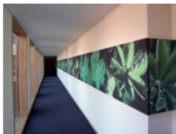
Referenz Alpenhotel Bitschnau in Schruns.