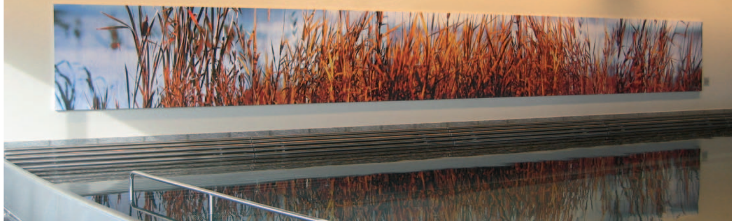
Kunst(voll) in Szene gesetzt – „Home of Balance“ Dornbirn.