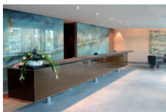
Referenz Sheraton Hotel in Dornbirn.